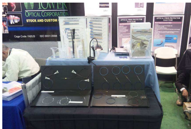
2011年 フォトニクスウエストでの展示 (USA)

会期 2011年4月13日(水)～15日(金) 開場時間 10:00 - 18:00 (15日のみ17:00終了) 会場 東京ビッグサイト 出展ブース 東4ホール 41-10