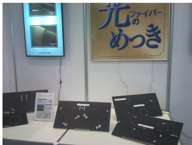
2010年 インターオプトでの展示 (横浜)