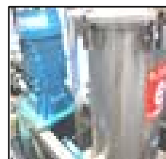
黒色無電解ニッケル用 自動管理装置 （濃度管理、補給液）及び精密ろ過機設置